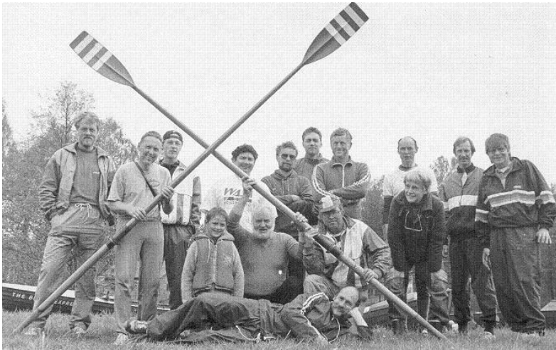
Deltagarna vid långturen på Bergslags- kanalen

Föreningen anordnade en mycket uppskattad tredagars långfärdsrodd på Bergslagskanalen i början av juni med 16 deltagare.