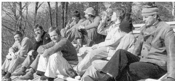
Paus i arbetet med takläggningen

Med ekonomiskt bidrag från Fritidsförvaltningen i Stockholm har ny toalett byggts i omklädnadsrummet, ny dörr i trapphuset och en ny ytterdörr sats in. Arbetet med att lägga nytt yttertak har avslutats.