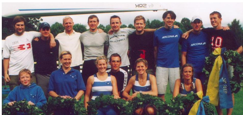
Stockholms Roddförening, bästa förening på SM