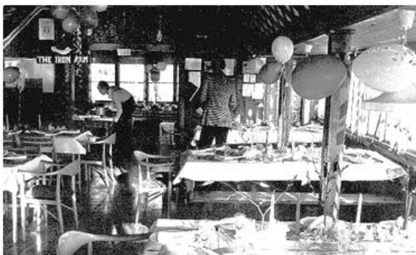
Här dukas det för 100-årsfesten