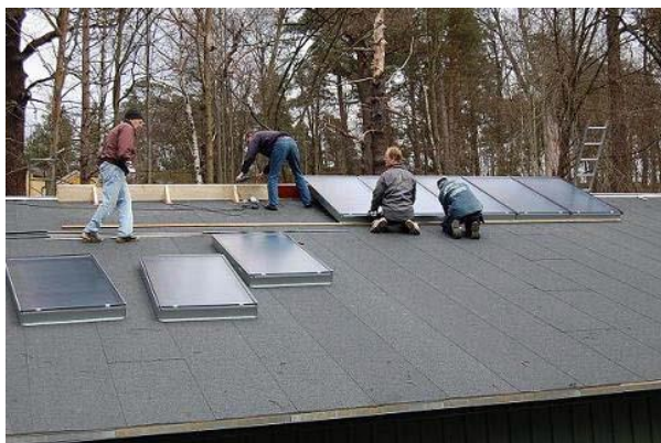
Solfångaren monterats på nya båthallen

SRF har även medverkat i arrangemangen på Magelungen av Farsta-rodden den 10-11 maj, serierodden för seniorer den 9 augusti och SM/JSM 22-24 augusti.