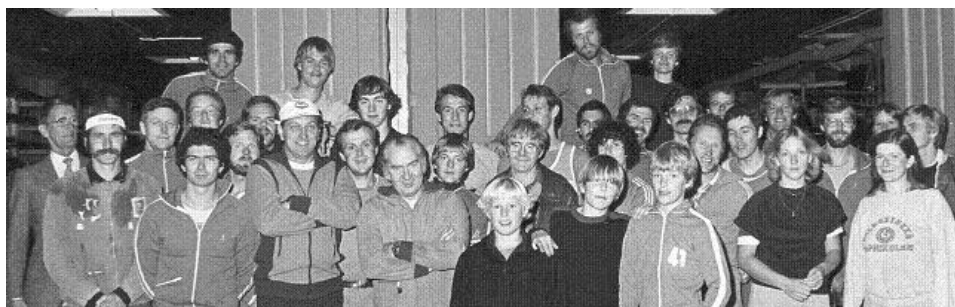
4 åttor deltog vid klubbmästerskapet

Den 26 maj arrangerade föreningen en jubileumsregatta på Djurgårdsbrunnsviken med deltagande av föreningar från hela landet.