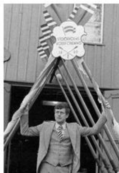
Ordf vid entrén

Den 26 maj arrangerade föreningen en jubileumsregatta på Djurgårdsbrunnsviken med deltagande av föreningar från hela landet.