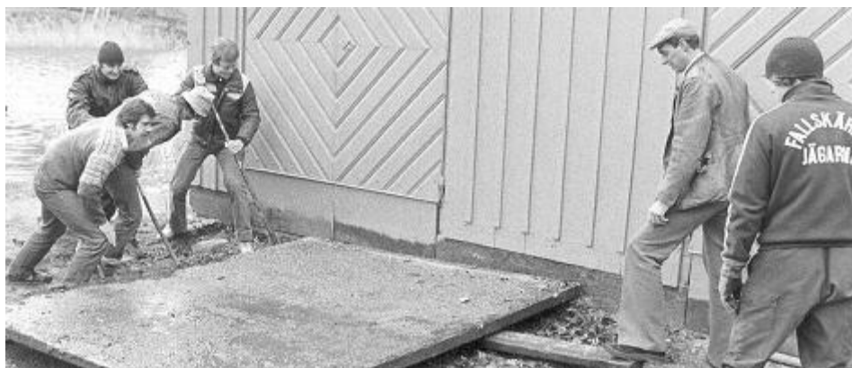
Plattornas höjd framför portarna justeras, även om man har kepsen på sig går det